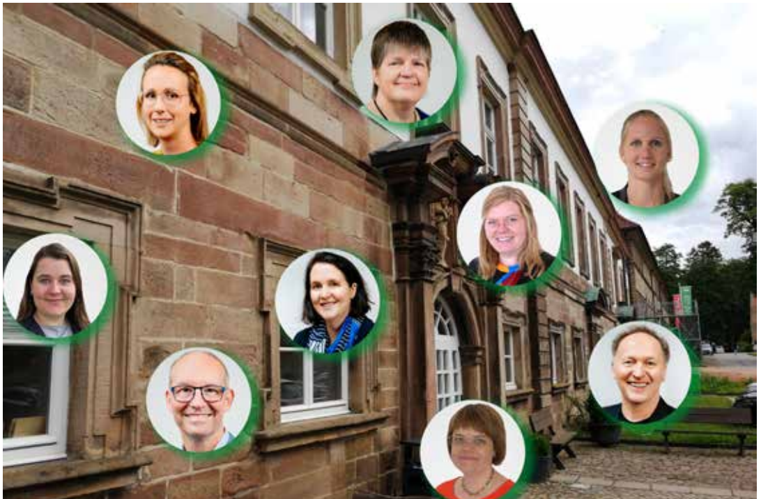
Das aktuelle Kernteam der Landvolkshochschule

fang, Hausservice, Haustechnik, Speisesaal und Küche sowie IT- und Medientechnik für beide pädagogischen Einrichtungen durchgeführt. Einschließlich dieser Kolleg*innen arbeiten über 100 Menschen für das Wohl der Gäste. Das Kernteam der Landvolkshochschule, Dozierende und Sekretariat, wird durch einen ausgewählten Kreis externer Referent*innen unterstützt. Mit ihren Angeboten, Inhalten und Kompetenzen ermöglichen sie uns diese breite Programmpalette.